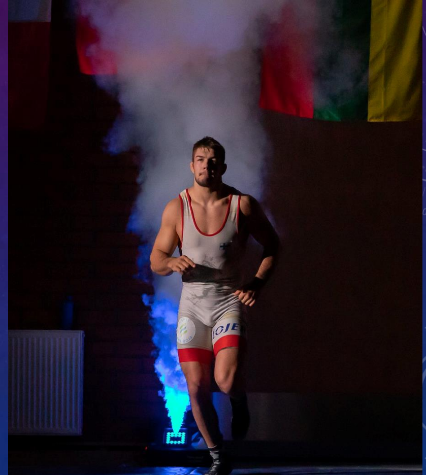
Arvi Savolainen – matkalla Pariisiin, yksi Suomen potentiaalisimmista mitaliurheilijoista!