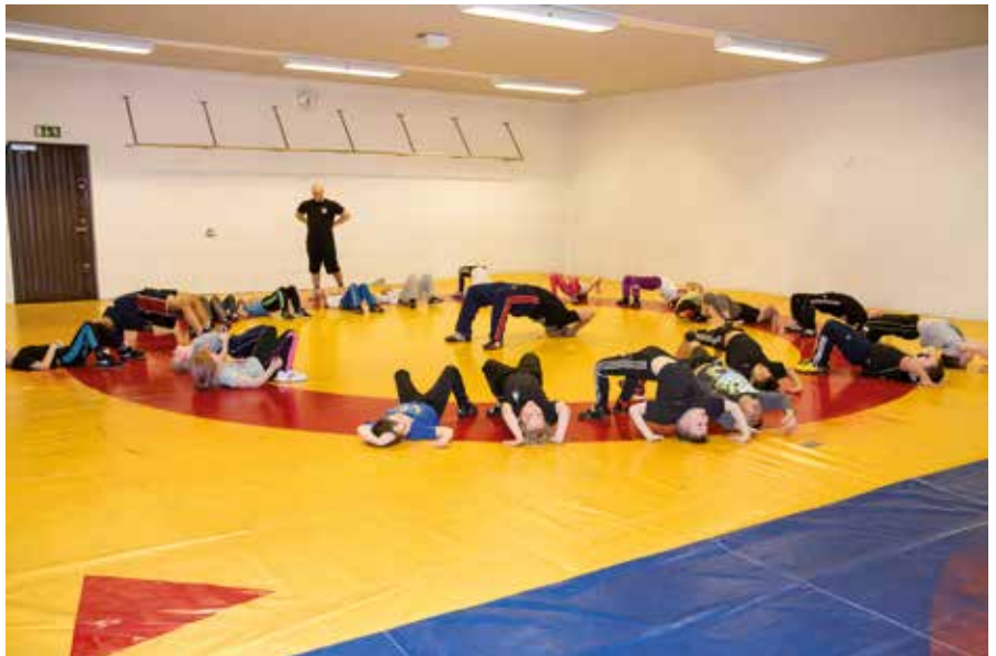
Tervahallin painisalilla on opeteltu siltaa useamman tuhat kertaa.