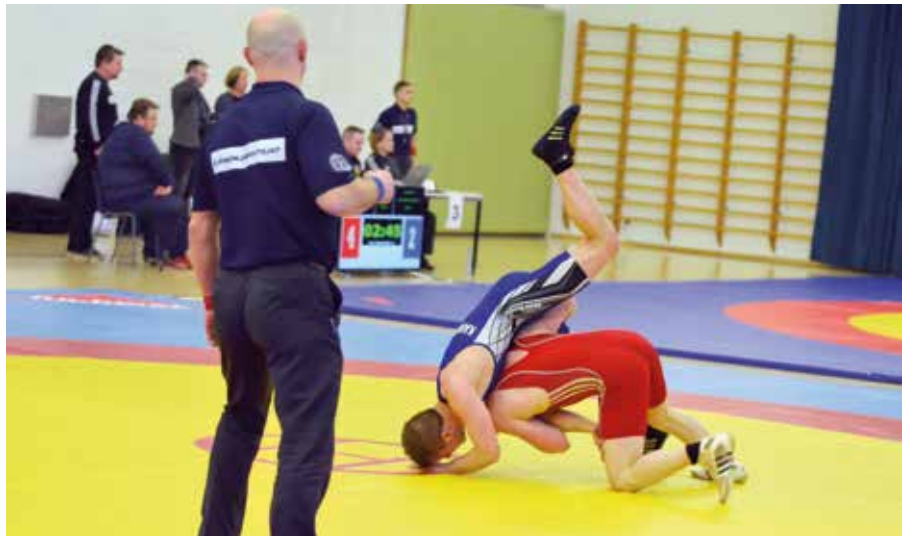
Porvoon SM-molskilla nähtiin vauhtia ja vaarallisia tilanteita.

-Kisojen tasoa virolaiset painijat nostivat huomattavasti. Siellä oli joissain sarjoissa erinomaisen taitavia virolaisia. Kaikki suomalaiset saivat hyviä matseja kovien vastustajien kanssa. Jos virolaiset olisivat