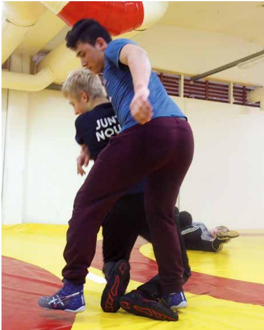
Suomen kieltä sana kerrallaan painin parissa.