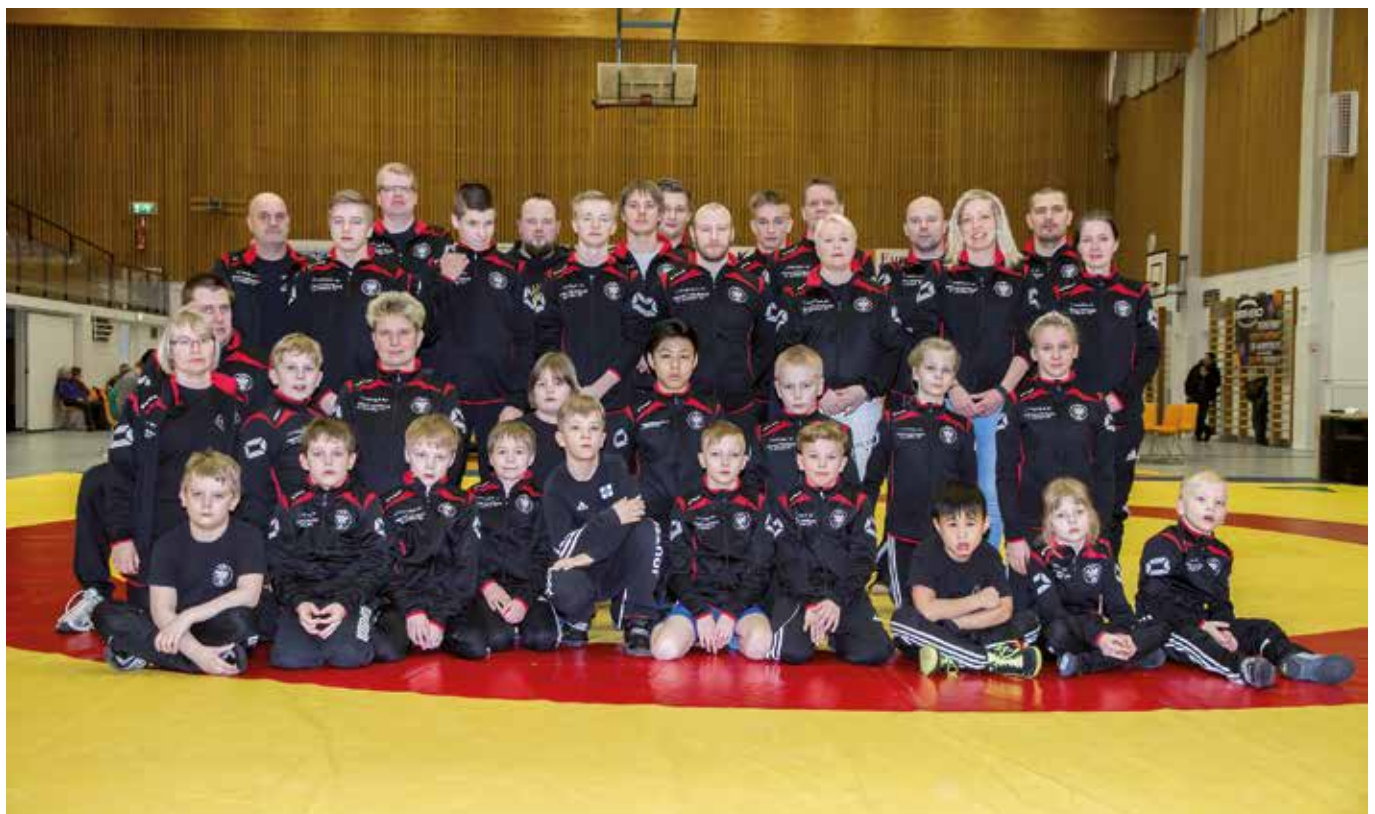
Kemin Innon komea porukka kuvattuna perinteisissä Rampan paineissa.